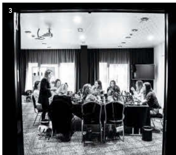
Agradecimientos: Barceló Raval, Barcelona.